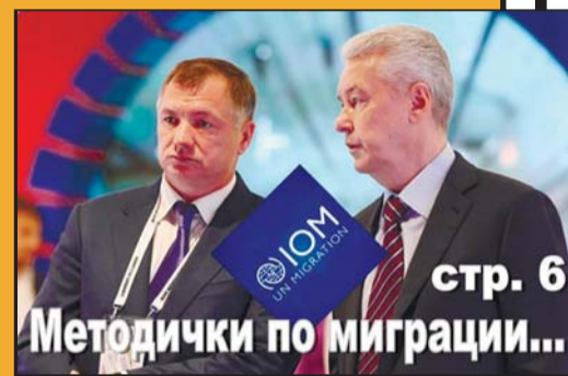
стр. 6 Методички по миграции...

Во Франции голосование происходит так: избиратель получает конверт, в котором находятся бланки с именами кандидатов. Он выбирает один бланк, кладет его опять в конверт, запечатанный конверт бросает в урну для голосования. Бланки для голосования можно получить лично, либо их рассылают по почте вместе с агитационными материалами. На выборах президента Франции в 2017 году избирателям разослали конверты, где все бюллетени за кандидата от оппозиции Марин Ле Пен были чуть-чуть надорваны. Это было незаметно глазу, но делало такие бюллетени недействительными. При подсчете голосов их просто уничтожали. При этом, бюллетени за Макрона были абсолютно