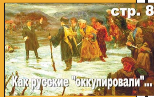
стр. 8 Как русские "оккупировали"...