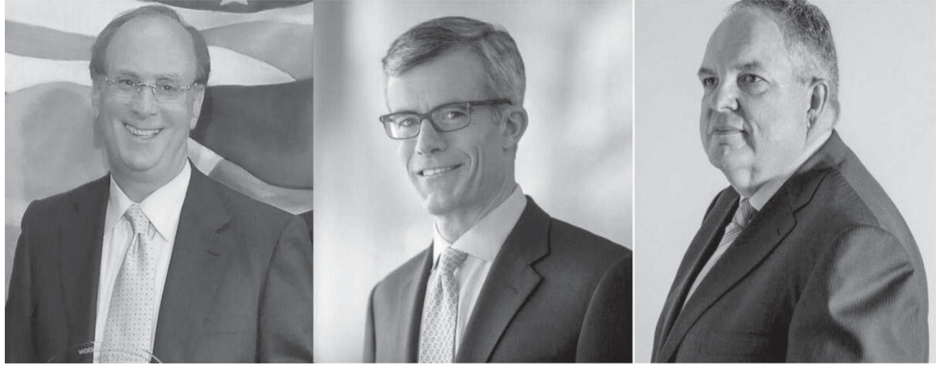
На коллаже: Лоренс Финк (председатель совета директоров и CEO) «БлэкРок», Мортимер Бакли (председатель совета директоров и CEO) «Вэнгард Груп», Рональд О'Хэнли (председатель совета директоров, президент и CEO) «Стэйт Стрит Корпорейшн»

Мультфильм «Я, домашний осел», где был заранее предсказан пожар в Нор-Дам в Париже и события в Ухане.