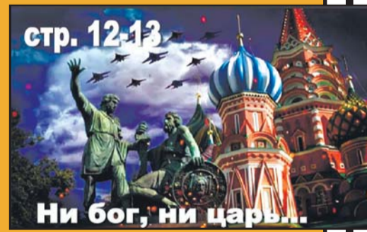
стр. 12-13 Ни бог, ни царь...